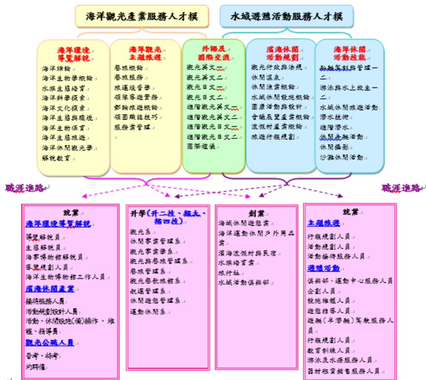
圖 4-4-6 海洋休閒觀光系五專課程模組及職涯進路圖