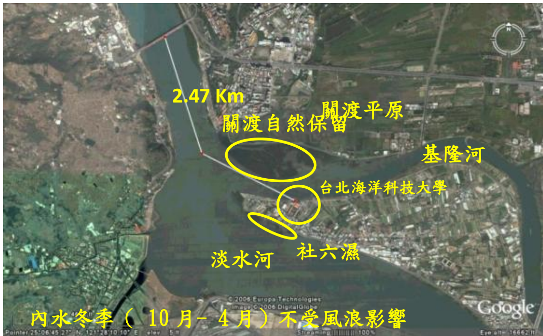
圖 4-4-2 本校士林校區衛星地理位置

本系所處地理位置優越，具備培育海洋休閒觀光人才的環境，也深具發展成為世界級海洋休閒觀光教育訓練國際交流平台之潛力。在此優越環境條件下，本系將能積極培養國內首屈一指的海濱休閒遊憩與海洋生態觀光相關產業之專業人才，在我國海洋休閒觀光的推動上扮演重要角色。