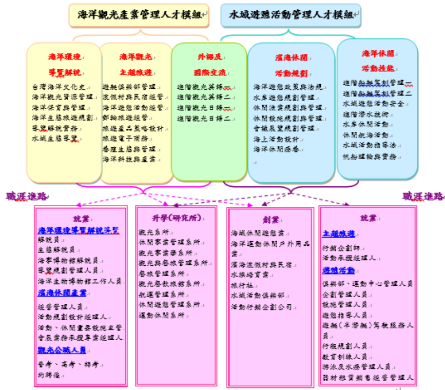
圖 4-4-4 海洋休閒觀光系二技課程模組及職涯進路圖