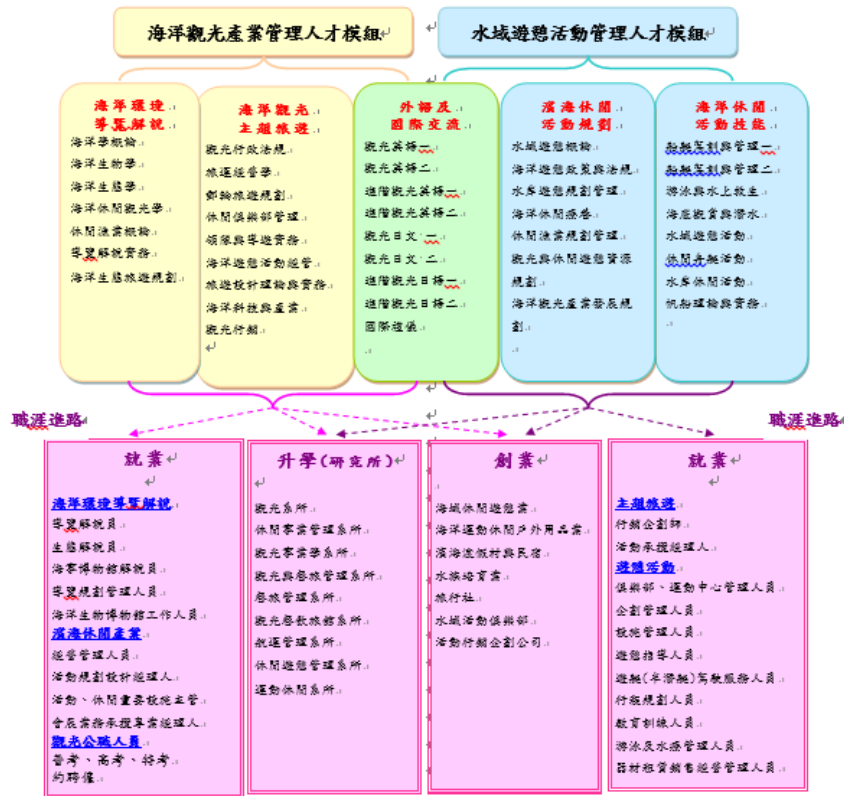
圖 4-4-3 海洋休閒觀光系四技課程模組及職涯進路圖