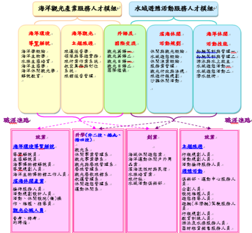
圖 4-4-5 海洋休閒觀光系二專課程模組及職涯進路圖